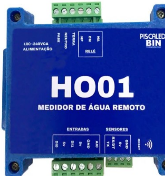
Figura 5: Identificação Conexões

O consumo máximo do produto é de 3W. Mas em operação normal, o consumo médio é de 1,5 Watts com o rele acionado e 1 Watt como rele desligado, que leva a um consumo de menos de 1kWh ao mês.